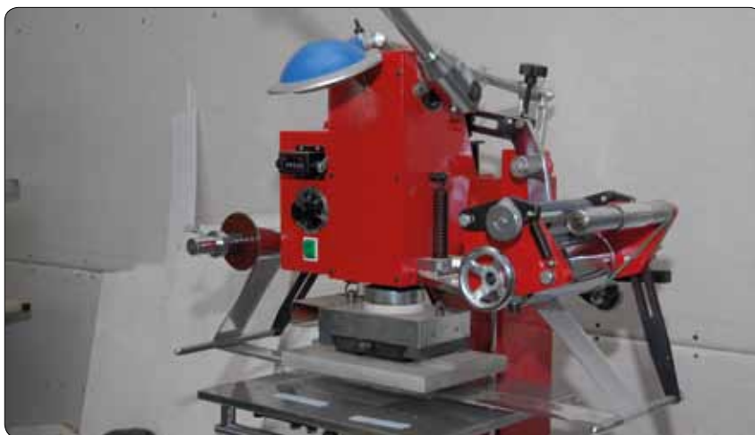
Оборудование для производства пластиковых карточек

Даже в кризисном 2008 году типография смогла улучшить технико-экономические показатели, увеличив собственную долю рынка. Сотрудники ознакомились с передовыми технологиями в области полиграфии, прошли специализированное обучение, освоили методику изготовления новых видов продукции. Для обеспечения бесперебойной работы производства, в условиях высокой загруженности, доукомплектовали отдельные модели оборудования, выполняющего конкретные задачи. И, в частности, благодаря расширению спектра услуг, компании «Абрис принт» удалось повысить свои позиции в рейтинге ведущих типографий Украины.