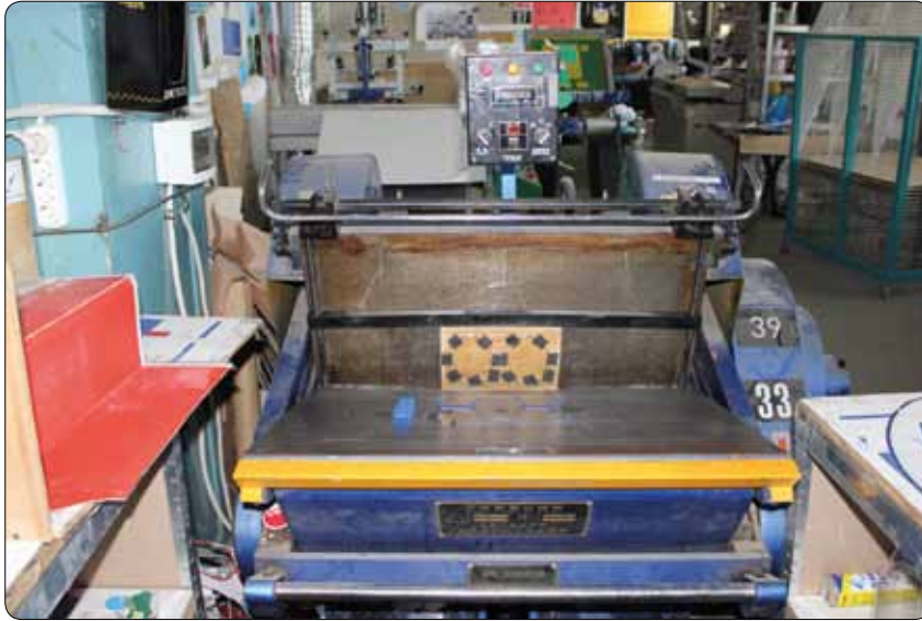
Высекальный пресс ML-750

сты компании «Абрис принт» до недавнего времени, использовали две машины Konica 7155, работающие в тандеме (с одним контроллером). Их суммарная производительность составляла около 110 коп./мин. листов формата А4, да и ресурс порядка 5 млн. экземпляров они практически выработали.