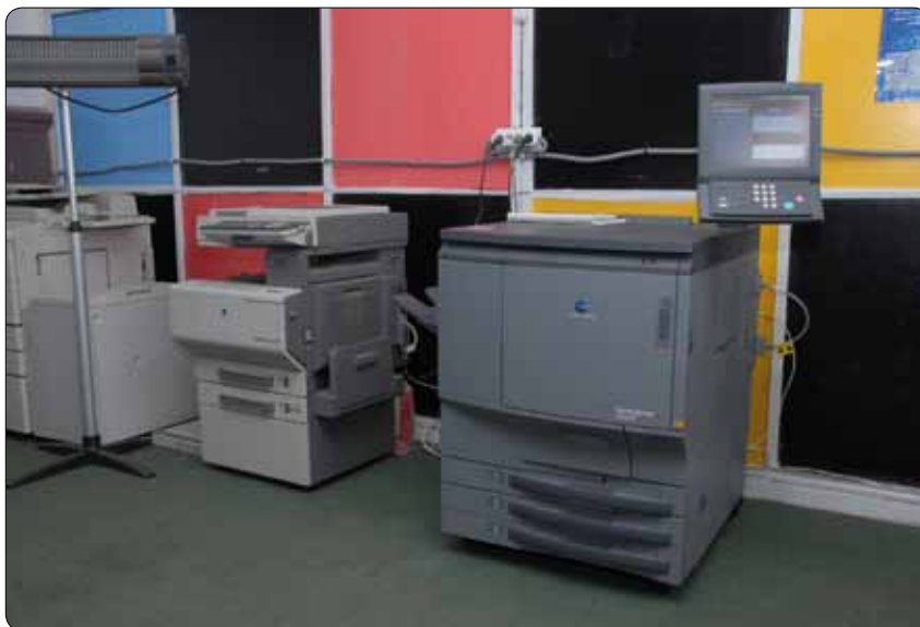
Цифровые машины Konica Minolta

Как правило, продукция цифровой печати выполняется на плотных дизайнерских картонах со сложными высечкой, тиснением и конгревом, покрытием